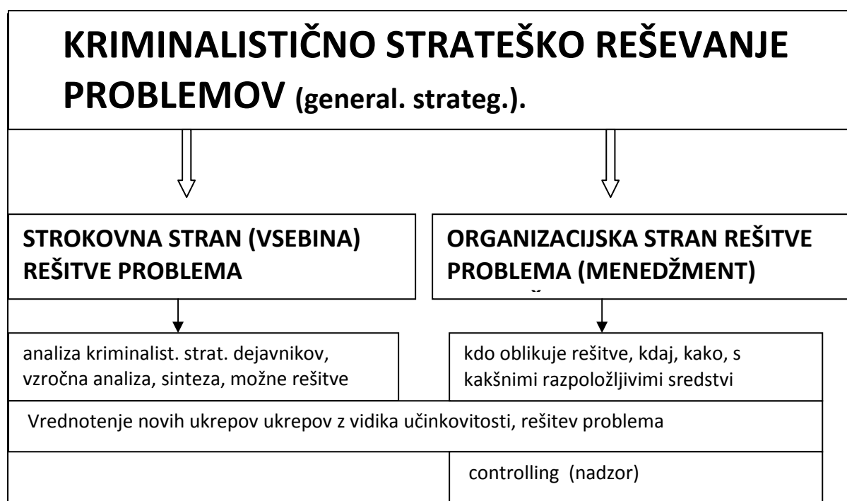
Shema 1: Kriminalistično strateško reševanje problemov.

Omenjeni dejavniki jasno kažejo, da kriminalistična strategija presega kriminalistiko, saj sta v njeni domeni le prvi dve skupini dejavnikov. Ob tem kaže poudariti da se novejša literatura ne sklicuje več na omenjeno delitev kriminalistično strateških dejavnikov. 10 Zanimivo je, da je v zadnjem desetletju deležna največje pozornosti tretja skupina dejavnikov, torej organizacija policije, sistem vodenja, njeni materialni in kadrovske resursi. To je posledica spoznanj o pomembnosti strateškega planiranja kot priročnega orodja za reševanje kriminalistično strateških problemov (Dvoršek, 2006, 235-242) pri katerem pa ima pomembno vlogo tudi policijski menedžment. Omenjena spoznanja so pripeljala do sklepa, da ima proces kriminalistično strateškega reševanja problemov, torej oblikovanja strategij dve celoti (Westphal, 2006), kot je razvidno iz sheme št.: 1.